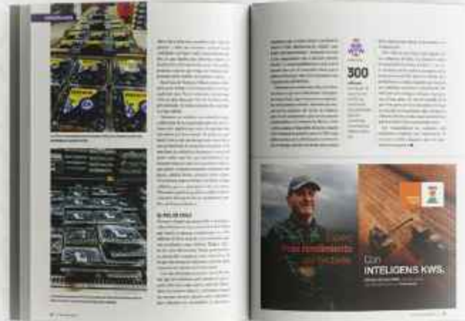
MEDIA PÁGINA HORIZONTAL ancho 185 mm x alto 125 mm (en CAJA)