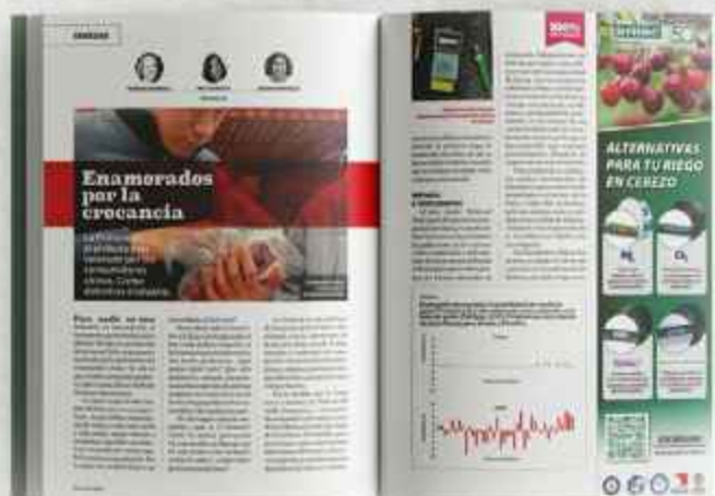
TERCIO DE PÁGINA VERTICAL ancho 70 mm x alto 275 mm (aviso AL CORTE. 3mm excedente por cada lado)