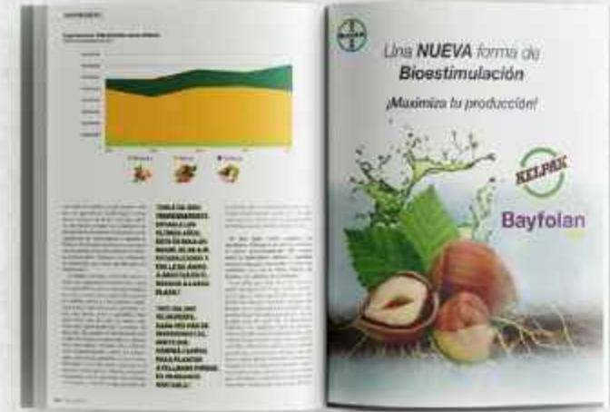
PÁGINA COMPLETA ancho 206 mm x alto 275 mm (aviso AL CORTE. 3mm excedente por cada lado)