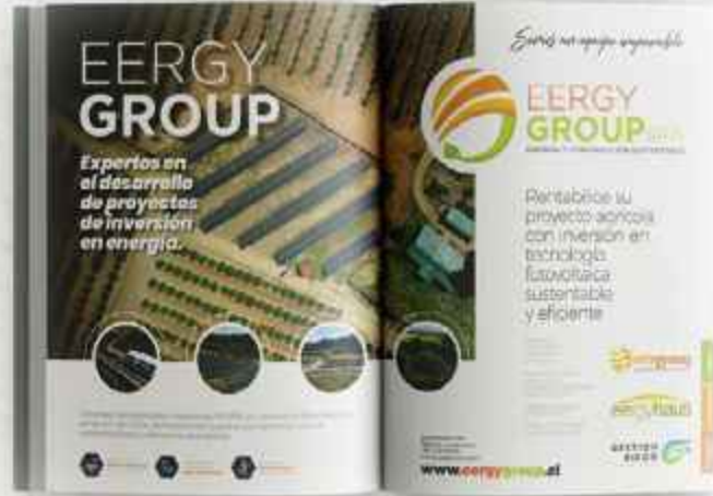
DOBLE PÁGINA ENFRENTADA ancho 412 mm x alto 275mm (aviso AL CORTE. 3mm excedente por cada lado)