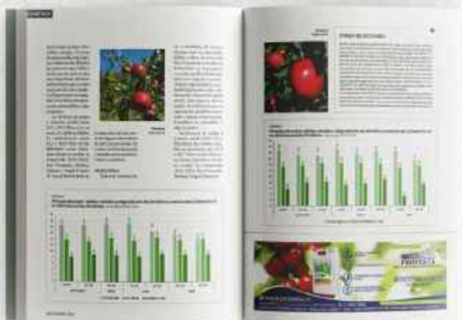
CUARTO DE PÁGINA ancho 185mm x alto 50mm (en CAJA)