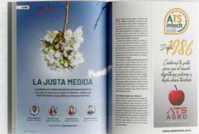
MEDIA PÁGINA VERTICAL ancho 100 mm x alto 275 mm (aviso AL CORTE. 3mm excedente por cada lado)